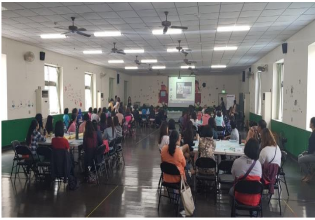
情境議題分組操作說明