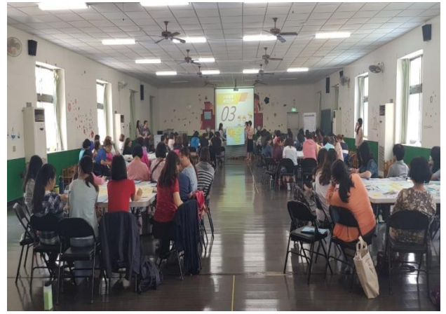
學員針對地震情意識題進行狀況 討論、商討處理方式及流程