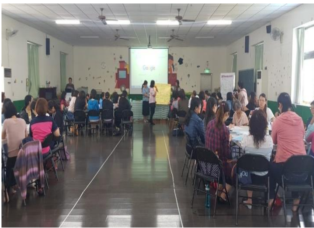
學員針對水災情意識題進行狀況 討論、商討處理方式及流程