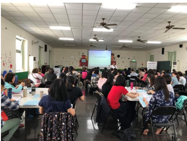
幼兒園校園災害防救計畫書編撰說明及示範