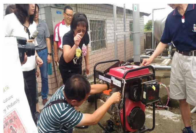
學員練習如何操作抽水機進行排水。